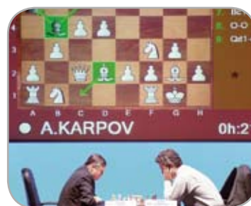
PROGRAMUL CHESS SHOW