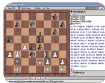
PROGRAMUL CHESS THEATRE